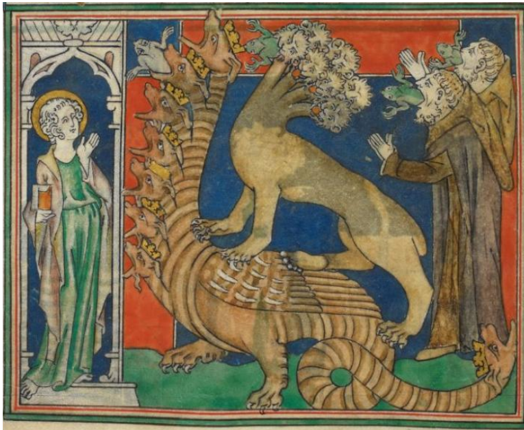
Los falsos profetas (Apocalipsis 16,13) Queen Mary Apocalypse, BL Royal 19, B XV, fol.30v.