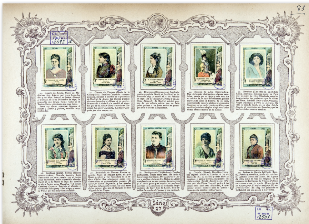
Sección de Ephemera de la Biblioteca Nacional de España, eph. 81 J2117-3534.

voluntad propia, marcó y elaboró su horizonte vital desde la diferencia alejándose de los valores políticamente correctos de su época. En esta nueva etapa varios acontecimientos íntimos y dolorosos se aprietan en su vida: el repentino fallecimiento de su padre en 1883 y la ruptura definitiva de su matrimonio que solo había durado escasos años. Acuña ha dejado constancia del desgarramiento provocado por la muerte de un padre que fue “luz” de su alma en un soneto firmado en febrero de 1883,