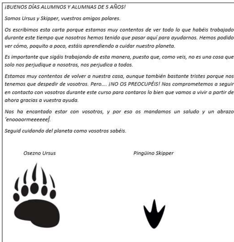
Figura 3.3. Carta de despedida de los protagonistas de la secuencia didáctica.

En asamblea, se procedió a la lectura de la carta de despedida (Figura 3.3) en la última sesión de la secuencia.