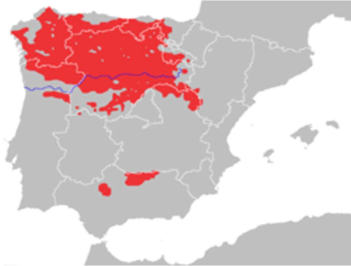
Figura 6.2. Localización de Canis lupus signatus en la península ibérica en 2013.

En la actualidad, con el fin de prevenir su extinción, se han implantado ciertas normas conservacionistas que impiden el ataque a estas especies, salvo en casos excepcionales bajo un régimen que lo controle. Nace así un término nuevo que es el control de la depredación. Pero, históricamente, existen tres etapas clave en España sobre la caza de especies: