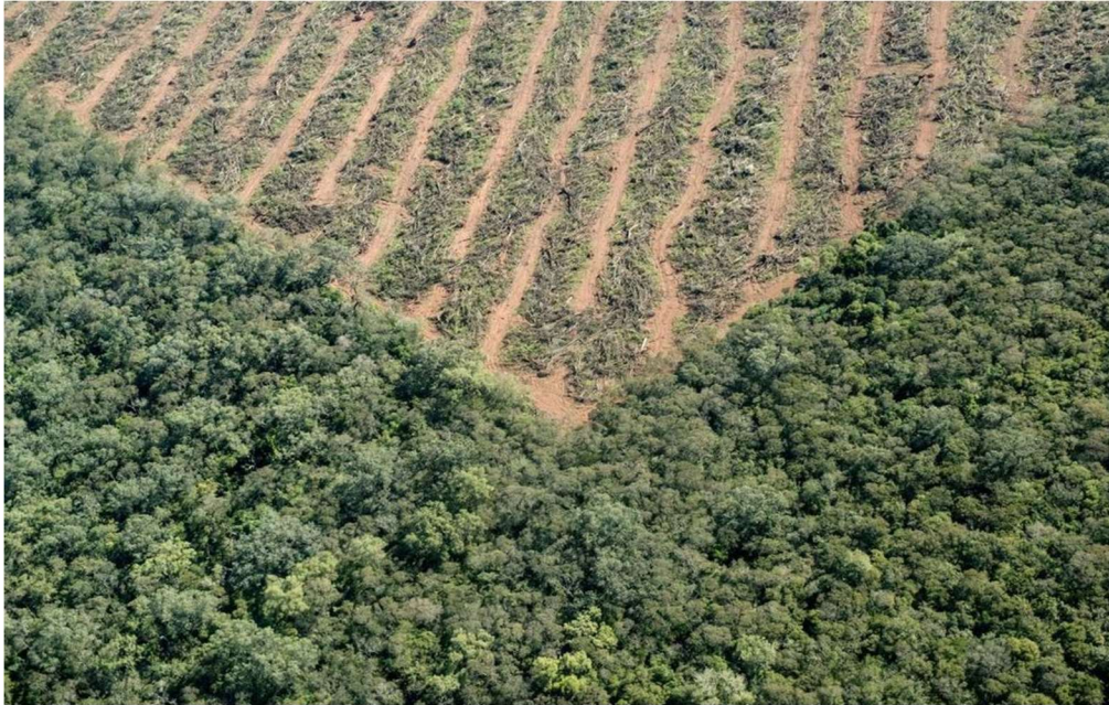
Figura 6.1. Fragmentación de los bosques por la acción humana.

De esta manera, el ser humano ha modificado en su propio beneficio la mayor parte de la tierra emergida útil (Loh y Wackernagel, 2004). Por este motivo, no nos debe sorprender que la destrucción de los hábitats, con su consecuente pérdida de especies, esté considerada como una de las mayores amenazas para la conservación de la biodiversidad.