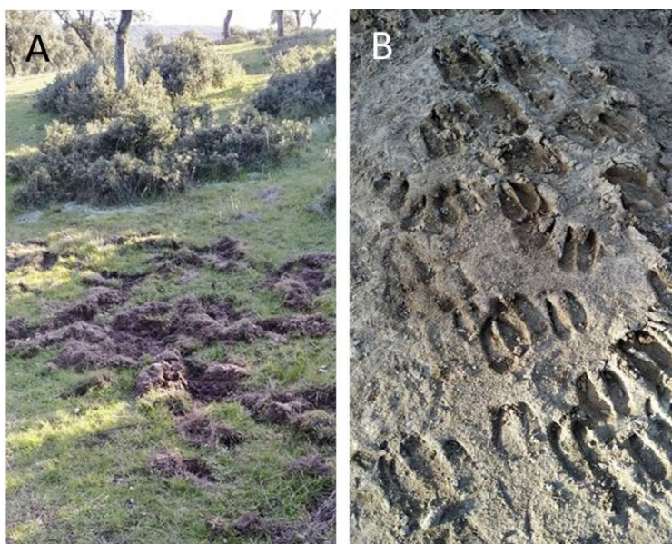
Figura 6.5. Marcas en el terreno propias del jabalí en la Dehesa Boyal de San Sebastián de los Reyes, lugar en el que se va a realizar la salida o recorrido didáctico con los alumnos del C.R.A. de Lozoyuela de Madrid. Hozas de jabalí (A) y huellas en el terreno (B).

Tendrán hasta la próxima sesión para terminar el cuaderno de campo y esta herramienta de registro nos servirá como método de evaluación, tanto de nuestros alumnos, como de los docentes y de la salida, observando si hemos logrado la consecución de los objetivos que nos marcamos al inicio.