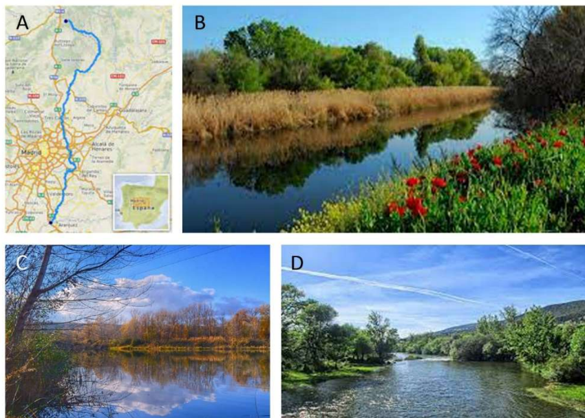
Figura 7.3. Imágenes utilizadas durante la sesión. Mapa de la región con el curso del río Jarama (A) https://cutt.ly/aTsBYWC ; Ribera del Jarama (B-D) https://cutt.ly/zTsBk3D , http://t.ly/90wS y https://cutt.ly/XTsBpVI (D).

Por último, se pide a los alumnos que comenten este tema en casa con sus familias, ya que puede que no sean conscientes del estado del río Jarama. Además, tendrán que dar al menos una idea durante la asamblea del siguiente día para intentar paliar las consecuencias ya ocasionadas en el río.