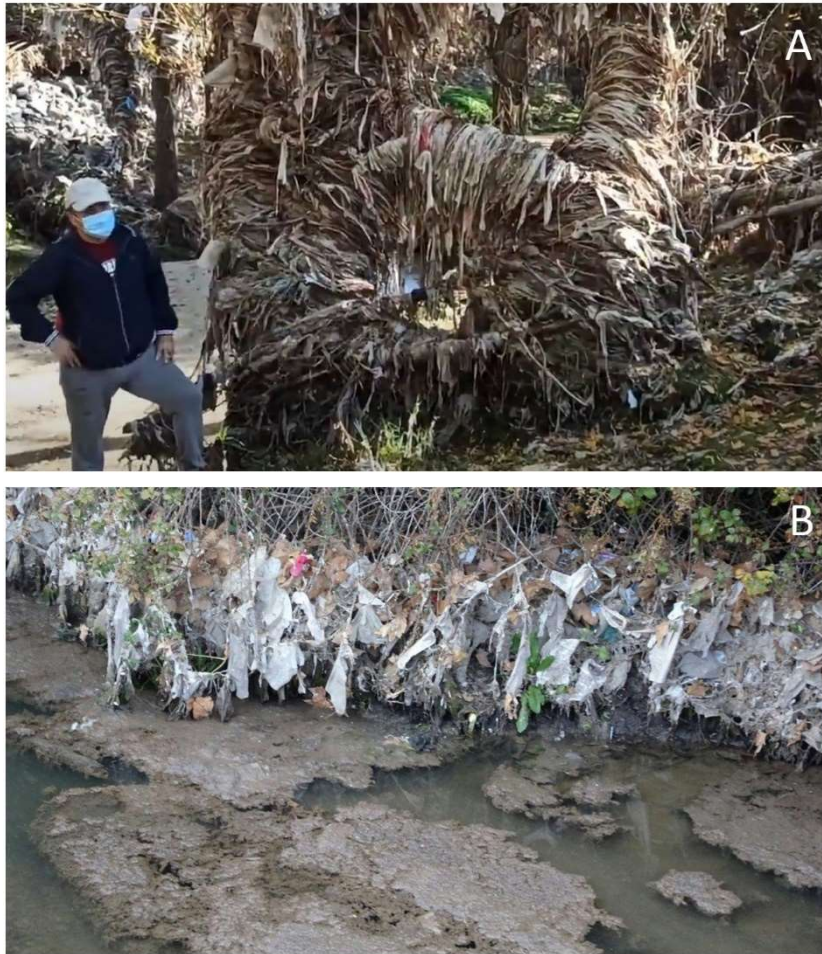
Figura 7.6. Imágenes del río contaminado de toallitas.

Dado que la lectura y comprensión de estas noticias puede resultar compleja para alumnos de primero de Educación Primaria, contarán con nuestra ayuda y, si fuera necesario, elaboraremos un resumen que recoja la información más importante de estas noticias para facilitar el trabajo de los estudiantes.