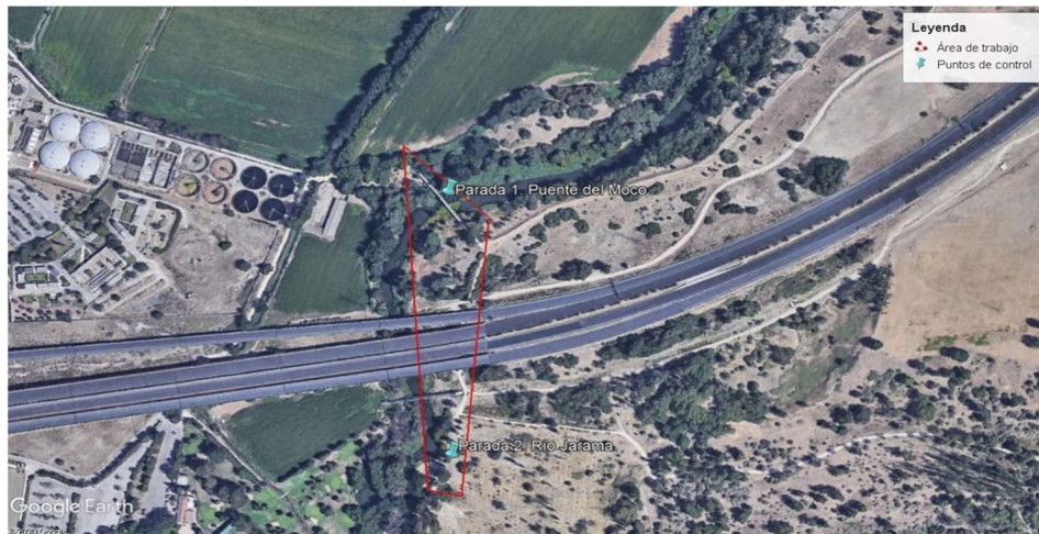
Figura 7.7. Área de recogida de residuos con los alumnos.

Tras lograr el apoyo de las otras clases, en esta sesión volveremos a acudir a la zona del río Jarama para realizar una limpieza de los desechos/basura que encontramos en la anterior excursión, centrándonos en la zona de la ribera del río y sus alrededores (Figura 7.7). Para ello, nuevamente se intentará contar con el apoyo de las familias y las asociaciones dedicadas al cuidado del río como la Asociación Ecologista del Jarama “El Soto” y Jarama Vivo .