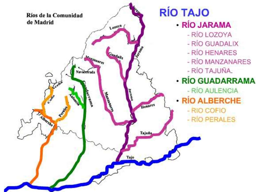
Figura 7.2. Imagen utilizada durante la sesión. Ríos de la Comunidad de Madrid.