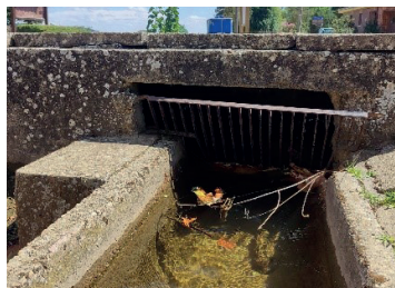
Figura 2. Ejemplo de acequia con barrera para filtrar sólidos de gran tamaño del agua.