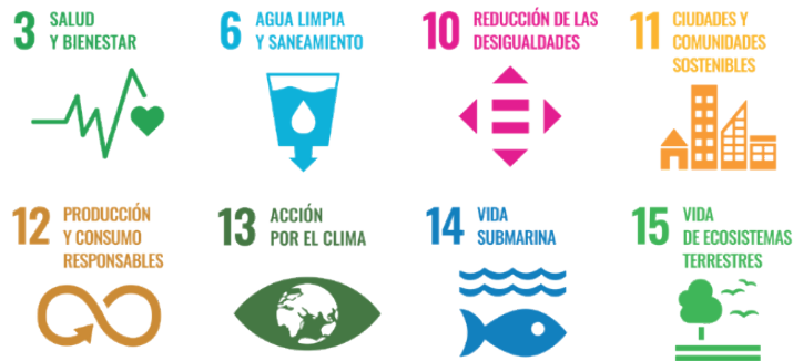
Figura 1. ODS relacionados con las problemáticas asociadas a la intervención humana en el ciclo del agua.

Centrándonos en el problema de la calidad del agua (ODS 6), una amplia variedad de contaminantes acaba en los lagos, ríos, arroyos y aguas subterráneas (ODS 15), y, por consiguiente, en