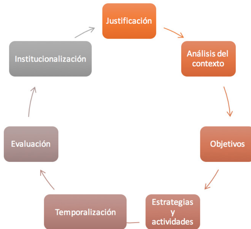
Figura 2. Estructura del Proyecto de innovación educativa

Suponiendo que estamos desarrollando un proyecto de alrededor de 50 páginas, contaremos con una Introducción o justificación introductoria de entre 1 y 2 páginas. A continuación, se desarrolla el epígrafe de análisis del contexto que consiste en no sólo la descripción del contexto, también el diagnóstico inicial de la escuela y la revisión del marco teórico con una extensión de entre 20 y 25 páginas. Después, se formulan los Objetivos (media página), Estrategias y actividades con entre 10-15 páginas de extensión, Temporalización (1 página), Evaluación e Institucionalización (3-4 páginas), y por supuesto, el listado de Referencias utilizadas (2-3 páginas). En algunos casos se concluye el proyecto incluyendo también una reflexión final acerca de todo el proceso desarrollado.