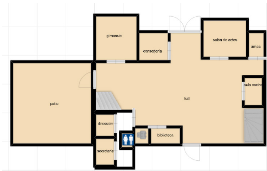
Figura 4. Ejemplo de plano planta baja de una escuela