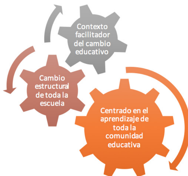
Figura 1. Elementos necesarios para el desarrollo de proyectos de innovación educativa

Un proyecto de innovación educativa es la herramienta con la que cuentan las escuelas para poder desarrollar las transformaciones que le permitan adaptarse mejor a las necesidades sociales actuales. Los proyectos de innovación educativa son documentos que establecen el modus operandi que permiten a la escuela y sus docentes actuar bajo un plan ordenado y sistemático que garantizará el éxito de las acciones diseñadas. Se trata de un documento, que al igual que el resto de los documentos de la escuela debe estar vivo, ajustándose a la realidad de la comunidad educativa y las necesidades reales que surgen cada curso.