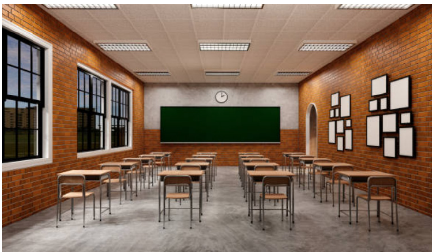
Figura 3. Ejemplo de imagen de aula