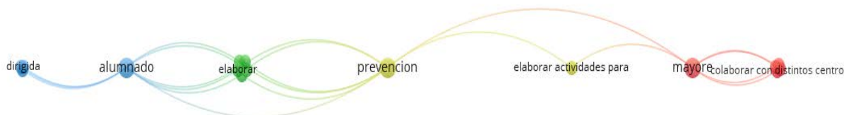
Figura 1. Co-ocurrencia de palabras proyectos de intervención

El análisis de co-ocurrencia de contenido aplicado a los objetivos determinó la existencia de cuatro clusters temáticos (azul, verde, amarillo y rojo). Como podemos ver en la Figura 1 dicho análisis permitió conocer que la intervención dirigida a personas mayores se basa en una metodología de aprendizaje-servicio dirigida a la prevención.