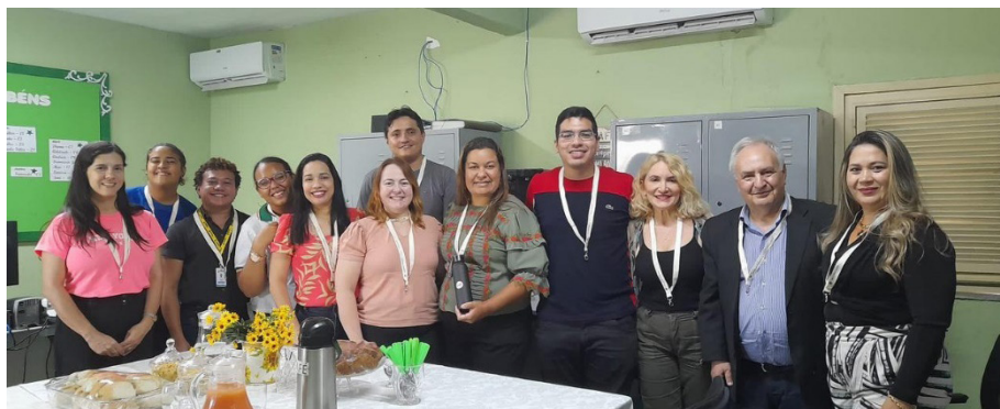
Figura 3. Assinatura do Termo Compromisso da Escola Monsenhor Gerado Ferreira Gomes.

Ainda no mesmo mês, a Escola Monsenhor José Gerado Ferreira Gomes, assinou o Termo de Compromisso do Projeto Nós Propomos e se comprometeu a colaborar em sua realização nas turmas de terceiro ano do ensino médio (Figura 03).