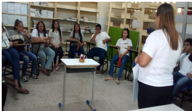
Figura 4. Apresentação no Projeto Nós Propomos! aos estudantes.