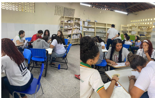
Figuras 05 e 06. Levantamento de problemas presentes no bairro pelos estudantes.

No mês de Agosto de 2023, no retorno às aulas do segundo semestre letivo após o mês de férias escolares de julho, foi solicitado aos estudantes uma lista prévia de problemas presentes no bairro Sinhá Sabóia e bairros adjacentes, de onde vem os estudantes, diariamente, para a escola. Na ocasião, as turmas foram divididas em três grupos de 5 estudantes e solicitado a eles que fizessem uma lista de problemas existentes no bairro com possíveis soluções. Os estudantes, assim, fizeram um debate no grupo e elegeram listar os principais problemas e escreveram em um cartaz com pincel. (Figuras 05 e 06). Após a atividade, organizamos a aula de campo a ser realizada no bairro no encontro seguinte, conforme calendário do Projeto.