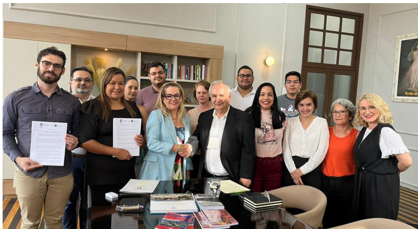
Figura 2. Assinatura do Termo de Cooperação entre a UVA e IGOT/UL.