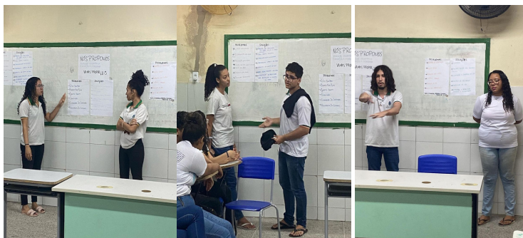
Figuras 10, 11 e 12. Apresentação de propostas pelos estudantes para melhoria do bairro Sinhá Sabóia, após a realização do trabalho de campo.