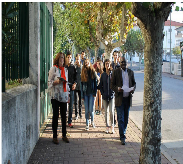
Figura 2. Alunos e docentes da Sertã percorrem a vila, onde identificam problemas locais

As crianças e os jovens em grupo de 4 ou 5 elementos ultrapassam os muros da escola e fazem percursos pelo território, desenvolvem pesquisas, fazem entrevistas, inquéritos de rua, tratam os diversos dados coletados, elaboram relatórios e