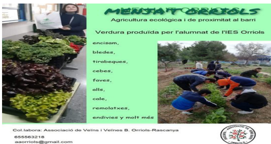
Imagen 4. Ejemplo de cartel de venta y de donación de productos agrarios del huerto a la asociación

Para todo ello, hablamos de personas que lo necesitan y lo reclaman como condición indispensable para poder recibir los productos ecológicos agrícolas que se cultivan en el instituto. En este aspecto, se respeta mucho la privacidad y nadie se le pregunta. La tarea de la asociación es organizar el reparto de los diferentes productos agrícolas a los diferentes colectivos.