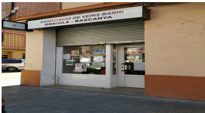
Imagen 3. Local de la Asociación

Hay que destacar la presencia de las mujeres en esta asociación porque los hombres iban y venían mientras que eran ellas, las que permanecían al darse más cuenta de los diferentes problemas del barrio ya que se encargaban de la compra y mercados, de los hijos, de las casas y también evidentemente de donde estudiaban sus hijos. Trabajando, además, en empleos precarios e inestables (estando limpiando la mayoría) y que cuando se casaban habían de dejar su trabajo. A este respecto, se propuso la existencia de un feminismo “visible” (en palabras de la presidenta de la asociación) porque hablamos de mujeres que se encargaba de todo, veían todos los problemas del barrio y no podían seguir sus planes profesionales o de realización personal.