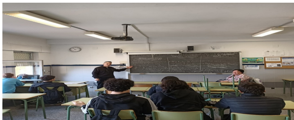
Imagen 6. Preparación de la clase con la presidenta de la Asociación del barrio Orriols-Rascanya

Se ha destacar que en esta actividad casi todo el alumnado empezó partiendo de propuestas del estilo de más policía, más vigilancia o cámaras. Pero a medida que iba avanzando la clase al alumnado comprendió tanto por ellos mismos como por la presidenta que las propuestas de más educación, más información o talleres como trabajo cooperativo para aquellas personas que no hagan cosas correctas y el seguimiento profesional de trabajo social o psicológico. Toda esta información fueron recogidas en la tabla 2 en cuestiones sociales como las ambientales en la tabla 3.