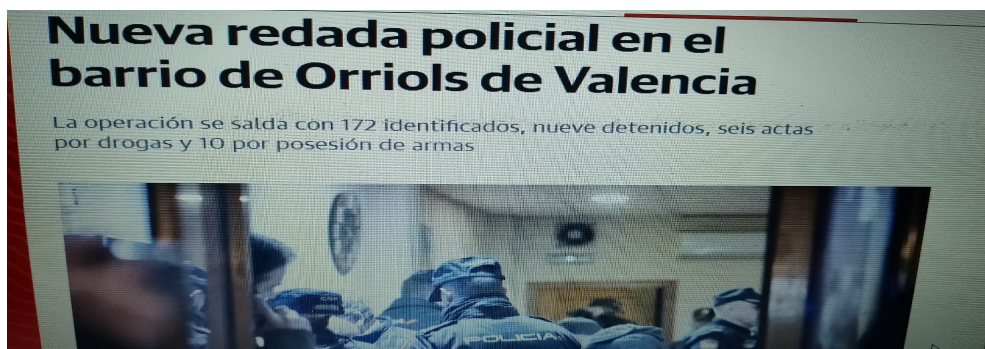
Imagen 1. Foto en el periódico Las Provincias de una redada policial

La participación ciudadana ha ido incorporándose como una competencia prioritaria en el desarrollo de la educación secundaria. La interacción de los centros escolares con los barrios en que están insertos son una oportunidad para redescubrir los espacios ciudadanos y problemas vecinales. En este sentido, el IES Orriols presenta un proyecto sobre cuestiones ambientales y sociales en su relación con la identidad y los problemas del barrio, pero ante partimos de que es Orriols.