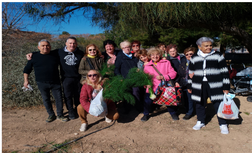
Imagen 5. Fotografía de la Asociación de vecinos y vecinas de Orriols en los huertos escolares del IES Orriols

El objetivo de este proyecto será acercar el producto fresco y saludable a las personas del barrio y poner de relevo los valores de estos productos de proximidad al mismo tiempo que se desarrollará un aprendizaje de servicio, que vinculará el alumnado socialmente con su entorno más próximo realizando acciones para mejorarlo y así como acercarse al concepto o idea de la alimentación mundial. Por otro lado también destacamos los beneficios entre la juventud de estas actividades relacionadas con el campo y el medio ambiente de cara a su crecimiento personal y profesional.