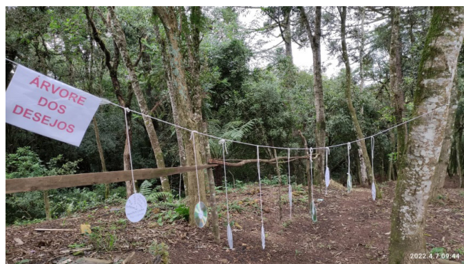
Figura 5. Construção da Arvore de desejos – Expectativas dessas pessoas privadas de liberdade.