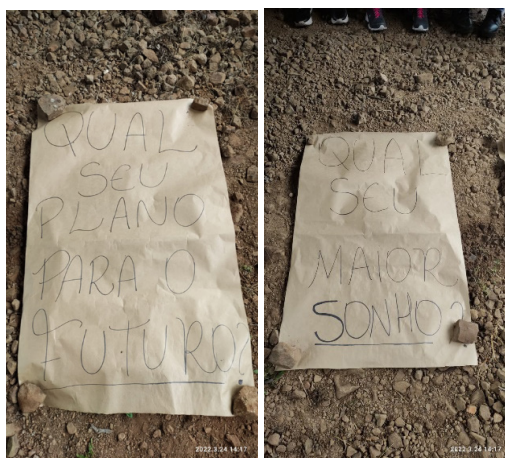
Figura 2. Momentos de troca de expectativas