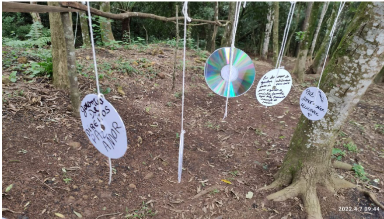
Figura 6. Sonhos e Expectativas.