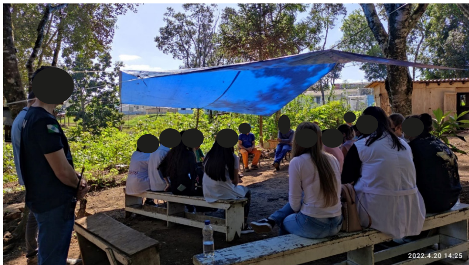
Figura 1. Círculo de Cultura e registro do Universo Vocabular.