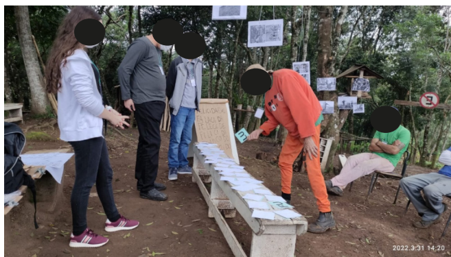
Figura 3. Seleção das palavras geradoras (codificação e decodificação).