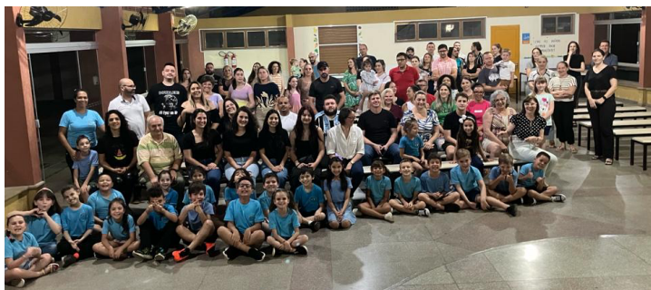
Figura 6. Apresentação das problemáticas e propostas na Câmara de Vereadores, contando com a presença dos alunos, pais, residentes, professoras da universidade, vereadores e de representantes da Secretaria de Educação do município.