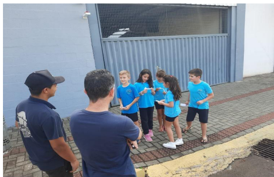
Figura 4. Os Pequenos Felinos em seu segundo estudo de campo.