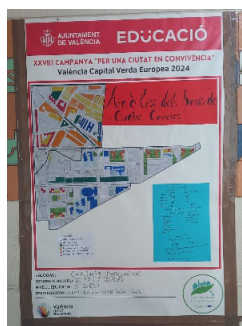
Figura 4. Cartel presentado en la Exposición en el Hall del centro el 27 de marzo de 2024.

Nuestra propuesta se desarrolla dentro del proyecto de innovación educativa del centro escolar, del proyecto de innovación educativa de la Universitat de València y participa en el proyecto municipal València Capital Verda Europea 2024. El producto lo conforman los mapas, los resultados de las encuestas y las fotos del barrio asignado.