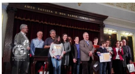
Figura 3. La Presidenta de la Junta Municipal de Russafa responde a las preguntas del alumnado. Diciembre 2022.