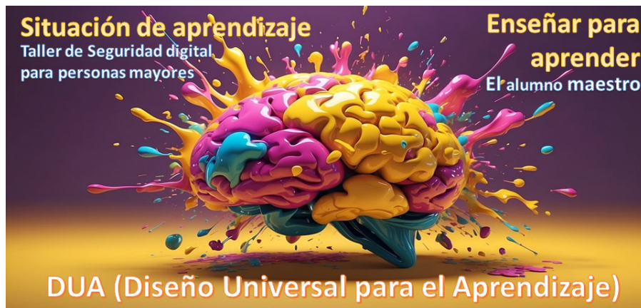
Figura 3 Metodología aplicada

de manera creativa y cooperativa, reforzando la autoestima, la autonomía, el pensamiento crítico y la responsabilidad (Castro Zubizarreta, 2024).