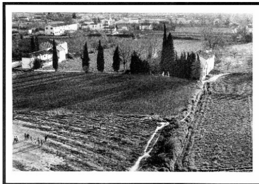
Figura 1. Ejemplo de ficha de trabajo.