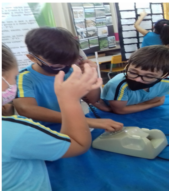
Imagem 3. Exploração do telefone de mesa de 1980 pelas crianças. 2021.

O rol de conteúdos desenvolvidos com o museu escolar trouxe, como destaque, o modo de mediar a construção e a organização dos conhecimentos geográficos pelos professores. Os conteúdos de Geografia integraram outras temáticas educativas e formativas, com a experiência cidadã, mostrando aos estudantes a participação, como agentes de transformação no espaço onde habitam, seja na escola, em casa, no bairro, bem como na experiência das atividades em grupo, na socialização e na integração dos estudantes. Eles contaram com experiências concretas, como exemplo o telefone de mesa, algo muito atrativo aos estudantes, considerado fora do contexto atual. Na imagem a seguir, um registro da amostra de um aparelho de telefone de mesa, da década de 1980, meio de comunicação utilizado pelos avós dos estudantes.