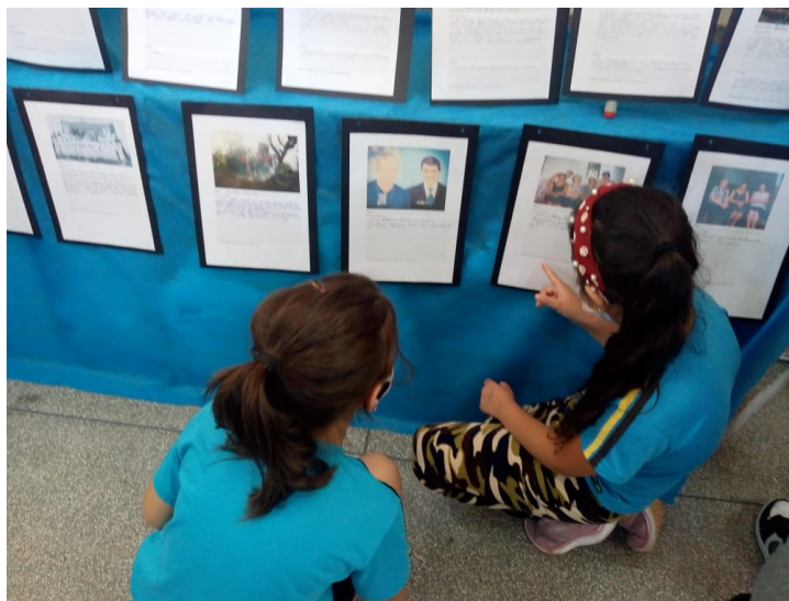
Imagem 4. Estudantes observando as fotografias e registros familiares. 2021.

Destacamos a satisfação dos estudantes e das famílias em contribuir com o museu escolar. O protagonismo dos estudantes foi comentado pelos familiares. Na imagem 05, o estudante mostra para a mãe as fotografias e as produções realizadas por eles.