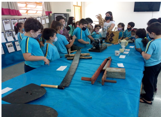
figura 2. estudo coletivo sobre o modo de vida e formas de trabalho entre gerações. 2021.

Os objetos trazidos pelos estudantes estão preservados, conservados e guardados como registros da memória histórica familiar e do lugar de vivência. Ficou evidente o valor sentimental e o carinho das famílias, com suas lembranças, nas demonstrações de afetividade e gratidão aos familiares que antecederem a existência de cada sujeito.