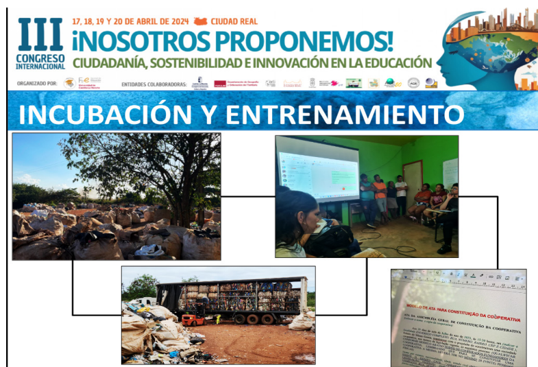
Figura 3. Processo de incubação dos coletores de materiais recicláveis pela ITCP UNIR.

Hoje, a ITCP UNIR possui onze projetos, mas os eixos articuladores das suas ações ainda permanecem: