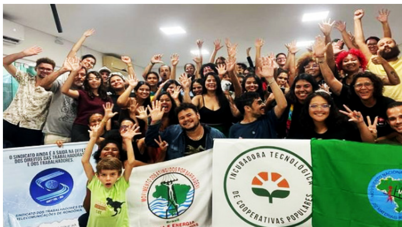
Figura 1. Membros da ITCP UNIR.

Portanto, este trabalho apresenta como o programa colabora com o desenvolvimento de Rondônia, na perspectiva da reciclagem do lixo, e das questões que envolvem sustentabilidade e cidadania; tendo a educação popular como o referencial metodológico das práticas, e a economia solidária como fundamento das relações econômicas, laborais e de autonomia; contribuindo, assim, para a alteração da realidade dos grupos populares, estimulando o protagonismo dos trabalhadores.