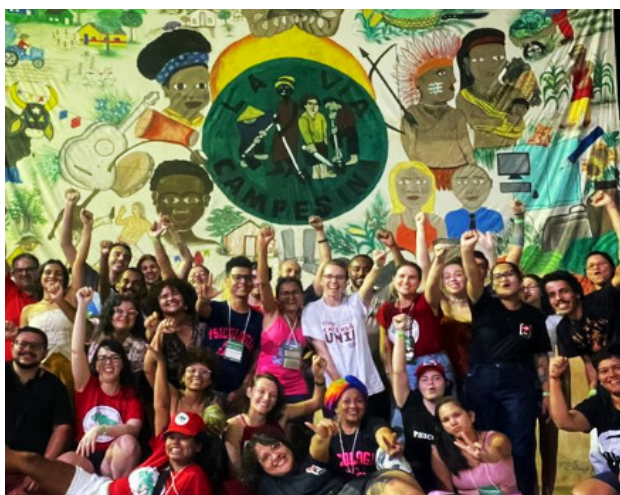
Figura 2. Membros da ITCP UNIR.