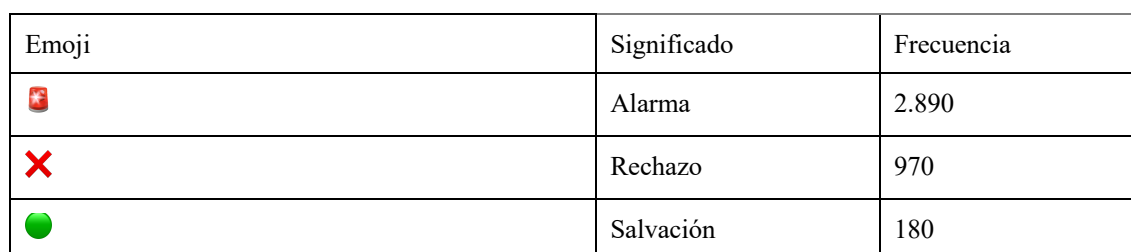
Tabla 3. Emojis con más de 100 menciones en la red #Garzón. 3 principales emojis que aparecieron en el debate #Garzón