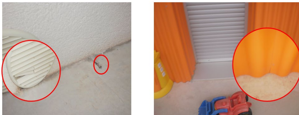
Figura 3. Ejemplo de falta de mantenimiento