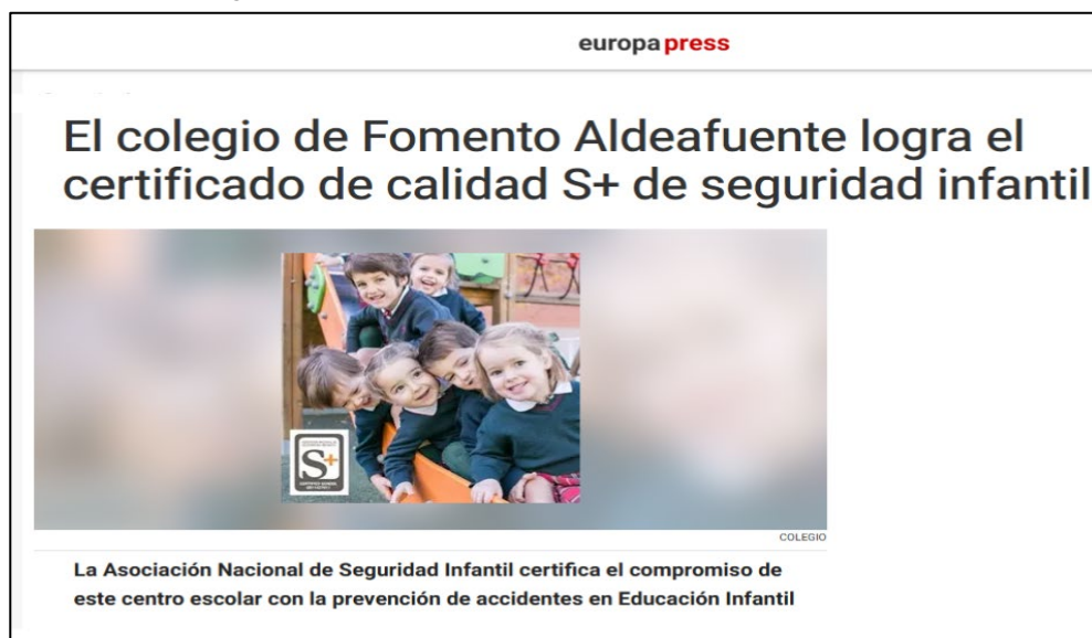
Figura 4. Difusión en medios del certificado de calidad S+

Una difusión correcta asegura que el reconocimiento llegue a una audiencia amplia, potenciando la visibilidad y el prestigio del centro.