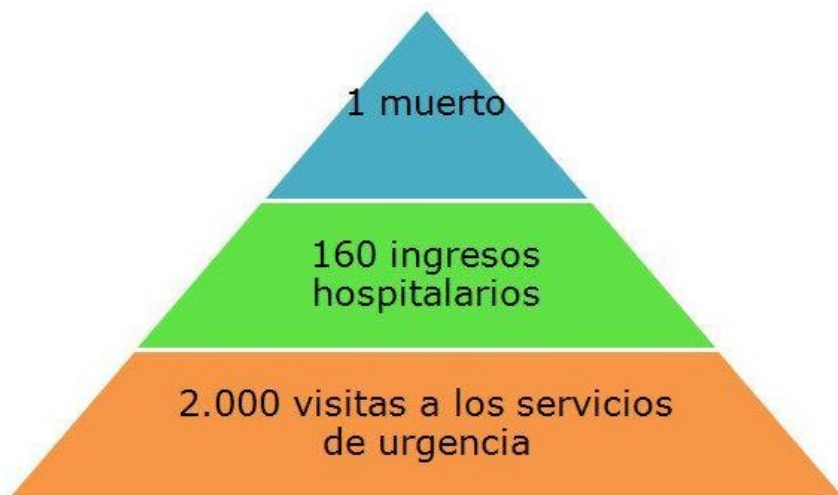
Figura 1. Pirámide de lesiones pediátricas [European Child Safety Alliance (ECSA)]

El tributo a pagar de los accidentes infantiles no queda aquí, además de las cifras resultantes en el gasto sanitario que tanto interiorizamos durante la pandemia, no podemos dejar de referirnos a otros daños que, también, implican un gasto a medio y largo plazo, además del factor moral y psicológico como son los años de vida potencialmente perdidos en caso de fallecimiento, las limitación, minusvalías, desfiguraciones o amputaciones; las afectaciones psicológicas y sufrimientos morales y físicos, tanto de los niños como de los familiares y cuidadores, el absentismo escolar y también laboral de las personas que deben cuidar de su recuperación, etc.