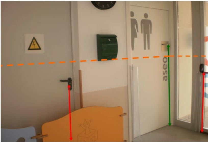
Figura 2. Ejemplo puertas para uso infantil

En la Figura 2 observamos un ejemplo de cómo las puertas que franquean los espacios de uso infantil incluyen las manillas por encima de la zona de seguridad para evitar que un menor pueda acceder, o salir, en un descuido sin supervisión. Sin embargo, aquellos espacios de riesgo de acceso a los niños que disfrutan de la instalación han integrado de forma conservadora, las manillas al acceso de los menores.