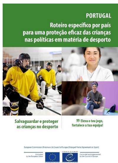
Figura 1. Capa do Roteiro desenvolvido para Portugal (versão portuguesa)