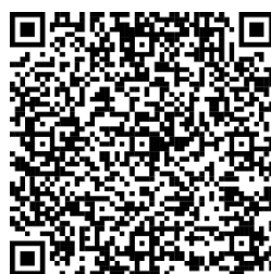
Código QR para aceder ao curso “Salvaguardar e proteger as crianças no desporto”